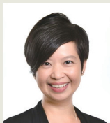
房屋局局長何永賢女士

會議主題「創新路向：把握北部都會區建造機遇，推動房屋發展與青年向上流動」，榮幸邀得香港特別行政區政府房屋局局長何永賢女士親臨分享。研討會將聚焦北部都會區的最新規劃與建造前景，深入探討香港在建造、房屋及青年發展方面的協作、創新、實用與包容路向，並邀請業界專家及政府代表參與交流。