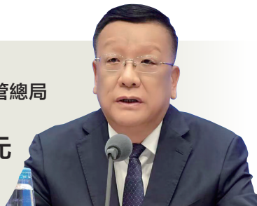
市場監管總局 副局長 白清元