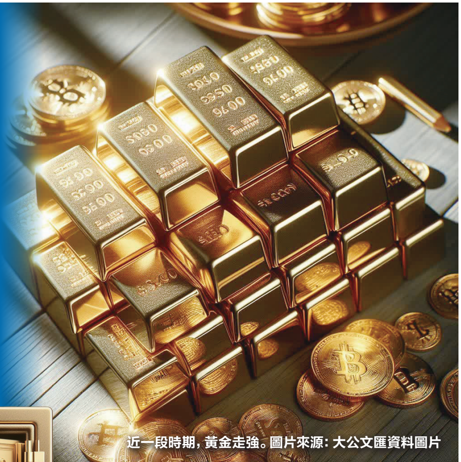
近一段時期，黃金走強。

4月7日，中國人民銀行公布2024年3月末官方資產儲備情況。數據顯示，截至2024年3月末，中國黃金儲備7274萬盎司，而2月末為7258萬盎司。這也是中國人民銀行自2022年11月以來，連續第17個月增持黃金儲備，累計增持了1010萬盎司黃金，按區間均價測算，對應增持金額超1400億元。