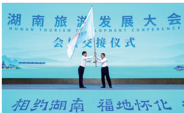
懷化市向第六屆湖南旅遊發展大會舉辦地湘潭市移交會旗。

辦會模式的創新不僅體現在開幕式和項目投資上，更滲透在大會的各個環節。專項評估辦法的制定、經費開支的壓減、市場化運營的推進，無一不彰顯著湖南創新思路辦會、務實節儉辦會的決心。