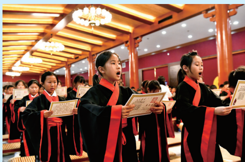
2023年6月9日，來自濟南大學附屬小學的同學們在曲阜市參加研學活動，並誦讀經典。