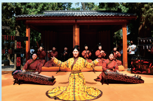
2023年6月27日，在曲阜孔廟，孔子博物館禮樂傳習所的工作人員進行以《詩經》為主題的雅樂表演。

優秀傳統文化厚植了中華民族現代文明的根脈沃土，涵養了中華民族現代文明的價值追求，匯集了中華民族現代文明的動力來源。我們將牢記習近平主席囑託，與海內外朋友一道，實踐全球文明倡議，攜手建設文化繁榮、物質富足、共同富裕、環境友好、開放包容的現代文明，為構建人類命運共同體作出新的更大貢獻。