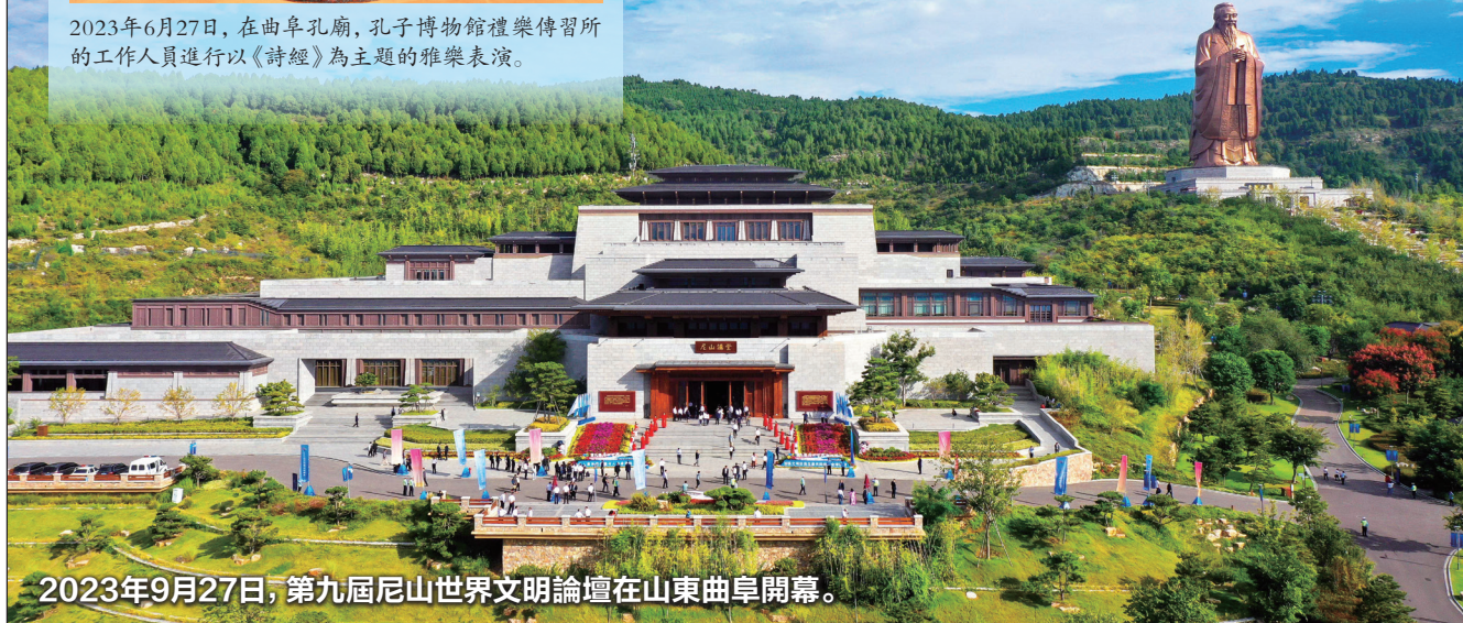
2023年9月27日，第九屆尼山世界文明論壇在山東曲阜開幕。