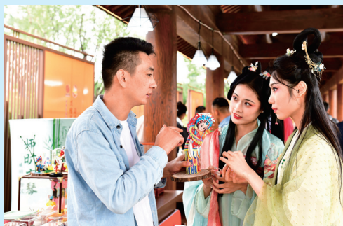
2023年9月26日，在第九屆尼山世界文明論壇“山東手造”精品展區，與會人員在介紹國家級非遺曹州面人作品。