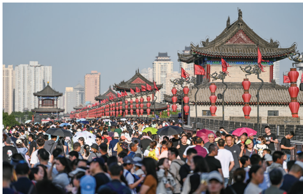
►五一黃金周有2.7億人次出外旅遊，同比增長達70%。圖為假期期間的西安城牆景區。（新華社圖片）

復性的，內生動力還不強，需求仍然不足，經濟轉型升級面臨新的阻力。會議強調，擴大需求是當前經濟持續回升向好的關鍵所在，須堅持兩個“毫不動搖”，持續提振經營主體信心，幫助企業恢復元氣，包括鼓勵頭部平台企業探索創新。也就是說，這次會議以當前國內經濟內需不足為主要矛盾，為了讓經濟持續回升向好，把提振民營經濟、加大科技創新、改善消費環境作為2季度乃至下半年擴大內需的三條政策主線，而這三個方面都得以經濟的內生動力為支撐。內生動力的增強是化解內需不足的根本所在。