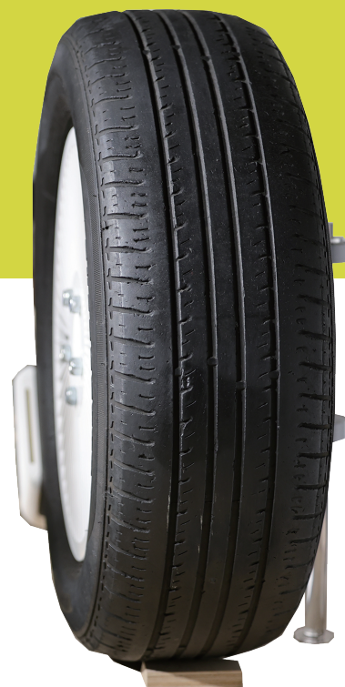
生物炭水泥與砂漿製成的汽車輪胎