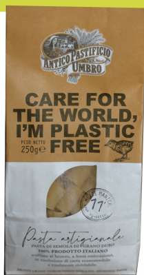
Mondi 意粉包裝——完全由紙製成