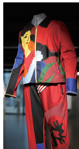
來自時裝界的 Stella McCartney、Adidas 和 Bethany Williams 的可持續時尚設計